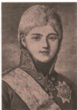
Александр I. С портрета Ж. Л. Вуаля,