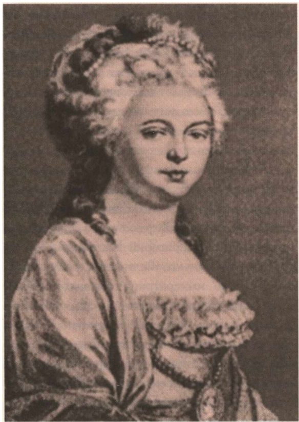
Мария Федоровна.