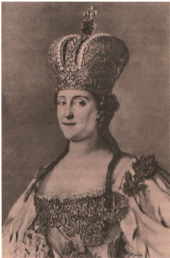
Екатерина II. С портрета С. Торелли 1162—1766 гг