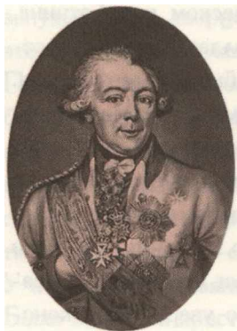
П. А. Пален. С гравюры Г. Валькера, по портрету Г. Кюгельхена, конец 1780-х гг.